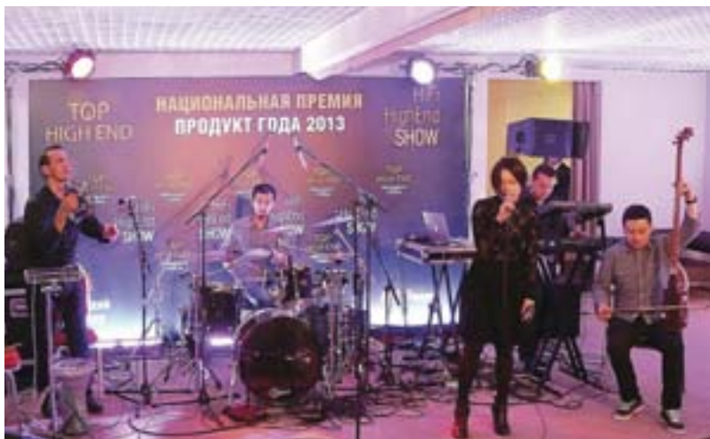
После награждения лауреатов премии «Продукт Го­да» состоялся концерт Севары Насархан. За это организаторам отдельное спасибо

Поскольку выставка — зеркало рынка, на её примере можно проследить некоторые изменения спроса и предложения. По сравнению с прошлогодним шоу стало меньше виниловых проигрывателей, а те модели, что выставлялись, имели тоже весьма серьёзные ценники. Цифровое аудио ввиду явных преимуществ вызывает гораздо больший интерес потенциальных покупателей, и торговые компании оперативно на это реагируют. Ещё один тренд — домашние кинотеатры почти всех хай-файных шоу вытесняются двухканальными компонентами, и экспозиция в «Аквариуме» не исключение. Дело здесь не столько в снижении интереса (кино по-прежнему остаётся для нас важнейшим из искусств), сколько в изменении бизнес-модели — серьёзные заказчики перекладывают проблему выбора техники на профессиональных инсталляторов, которые в теме и без всяких выставок.