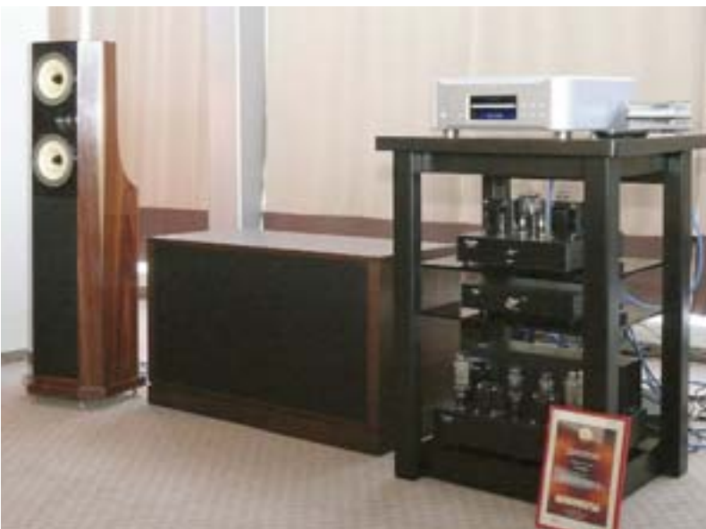
Такой дизайн может показаться легкомысленным, но на самом деле под маркой Podspeakers выпускается вполне серьёзная акустика. Что и подтвердил наш тест (см. с. 34) (Русская Игра)