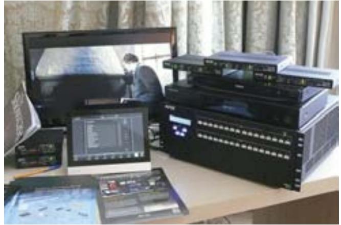
Интегрированное решение от AMX, позволяющее построить полную мультимедийную аудиовидеосистему и не требующее дополнительного программирования (Информ) )