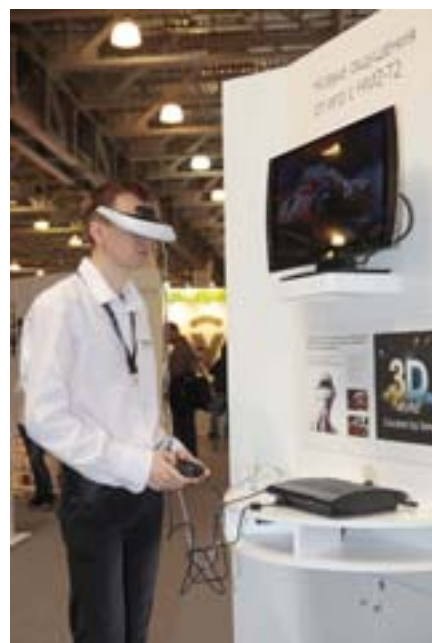
Передовые персональные гаджеты от Sony: совмещенный с наушниками подводный плеер W273, персональный 3D-монитор высокого разрешения HMZ-T2 и сверхминиатюрная видеокамера для экстремалов HDR-AS15