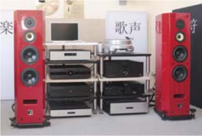
Интернациональный оркестр: CD-плеер Aesthetix Romulus и акустика Montana SPI (США), виниловый проигрыватель Acoustic Signature Thunder (Германия) и ламповые усилители Canor Audio из Словакии (Гонг АВ)