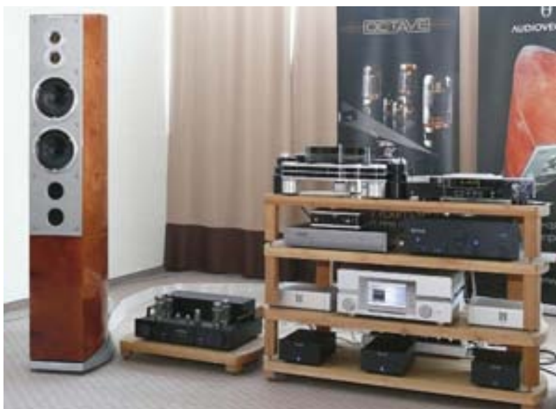
Акустические системы Audiovector R11 Arrete, музыкальный сервер Burmester 111, CD-проигрыватель Burmester 061, предварительный усилитель Octave HP500 SE, усилитель мощности MRE220 (Barnsly Sound org.)

Как и прежде, в VIP-зоне на шестом этаже выставлялись эксклюзивные системы, звучание которых демонстрировалось в течение дня по очереди. Ввиду непригодности помещения и высокого уровня окружающего шума от оценок мы очередной раз воздержимся. ☺