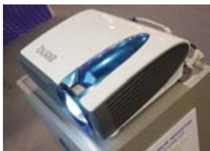
Первый в мире лазерный проектор BenQ LW61ST. Разрешение 1280 x 800, контрастность 80000 : 1, световой поток 2000 ANSI лм, ресурс в экономичном режиме — 20000 часов

Быстро растёт интерес к настоящему крупным телевизионным панелям, выдающим экстремально высокое качество. Радикальные киноманьяки и просто люди с достаточным уровнем доходов хотят получать от домашнего кинотеатра изображение, сравнимое, а возможно, и превосходящее по качеству картинку на экранах коммерческих кинотеатров. Именно с прицелом на них Sony устроила в «Крокус Экспо» премьерный российский показ 84-дюймового