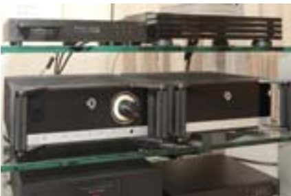
Горячие новинки от немецкой Avantgarde Acoustic — усилители XA-PRE Line и XA-Power. Лицевые панели могут быть оформлены под цвет акустики этой же фирмы, в числе вариантов даже натуральный шпон ценных пород дерева (Русская Игра)