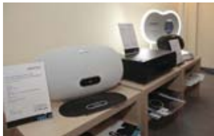
Denon Cocoon DSD-500 — универсальное решение в оригинальном дизайне (Бонанза)