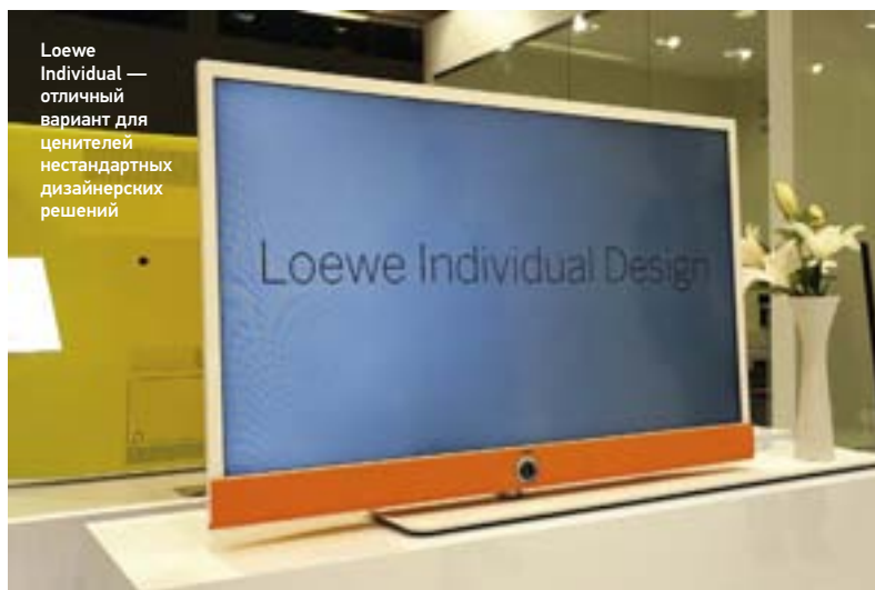
Loewe Individual — отличный вариант для ценителей нестандартных дизайнерских решений

Прямые конкуренты японского концерна в телевизионном секторе на выставке в этот раз предпочли не появляться, однако обитателей интерьеров премиум-класса порадовала Loewe. Детища немецких дизайнеров, как всегда, удивляли не только продвинутыми техническими характеристиками, но и совершенно нестандартным подходом к внешнему оформлению. То же, кстати, относится и к построенным на Loewe системам домашнего кинотеатра — почти плоские колонки и сабвуфер в металлическом корпусе не только впечатляюще выглядят, но и играют для дизайнерской акустики более чем убедительно. ☺