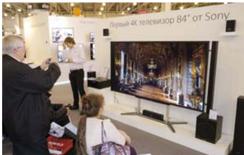
LED-телевизор Sony диагональю 2,1 м и разрешением 3840 x 2160 пикселей уже можно купить в России