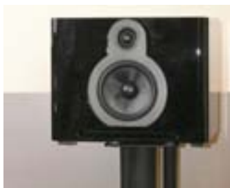
Guru audio — шведский бренд, ранее специализировавшийся на студийной акустике, домашние модели появились не так давно. Мониторы QM10 сделаны с расчётом на переотражения от стен, за счёт чего способны воспроизводить мощный бас. Динамики используются Wifa и ScanSpeak. Цена за пару — порядка 100 тыс. руб. (Barnsly Sound Org.)