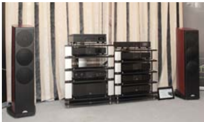
Новинки Naim: ЦАП/предусилитель DAC-V1, усилитель мощности NAP 100 и универсальное устройство UnitiLite, объединяющее стример (поток до 32 бит/192 кГц), сетевой плеер, CD проигрыватель, USB-ЦАП и усилитель мощностью 2 x 50 Вт. Акустика — Naim Ovator S-800 (Алеф)