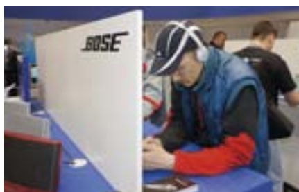
Любителям веселых компаний Bose предлагает беспроводную микросистему с аккумуляторным питанием, а эгоистам — наушники с активной системой подавления внешних шумов