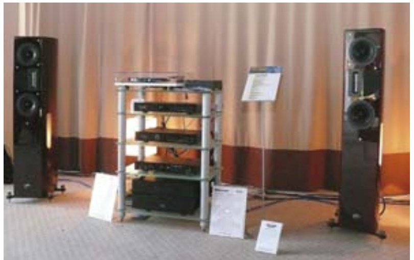
Акустика Apertura Audio Onira и электроника Bryston: цифровой плеер BDP-2, ЦАП BDA-2, предусилитель BHA-1, усилитель мощности 14B-SST2 (Инфорком)