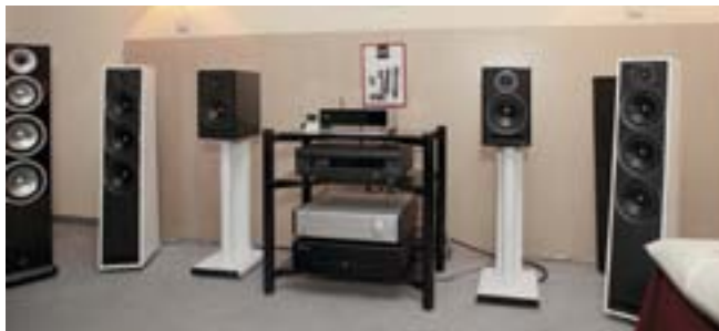
«Третья» линейка (3-Series) Acoustic Energy посвящена 25-летию компании. В этих моделях используется фирменный диффузор AE из анодированного алюминия, что позволило облегчить подвижную систему и, соответственно, увеличить чувствительность. Ровный импеданс позволяет работать с ламповыми усилителями, передний щелевой фазоинвертор даёт больше свободы при установке. Компания Homesound начинает представлять в России марку Orro, теперь вместо серой продукции будут официальные поставки напрямую от производителя, а также обеспечен год гарантии и сервисная поддержка