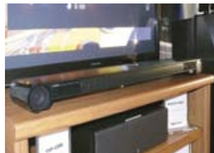
Yamaha, отмечающая в нынешнем году 125-летие, готовит к выпуску много интересных новинок. Из уже имеющихся — звуковой проектор YSP-4300 с беспроводным сабвуфером, интерфейсом USB. В комплекте адаптер AirWired для передачи музыкальных файлов с компьютера. Был показан также сетевой проигрыватель с CD-приводом CDN-500, который может получать контент по USB