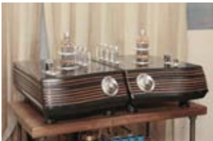
Однотактный усилитель The Essence российской фирмы Next Sound. Лучевой тетрод 6E813 обеспечивает выходную мощность 40 Вт, выпрямитель построен на четырёх демпферных диодах