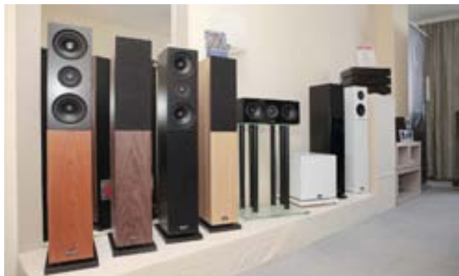
В каталоге немецкой Audio Physic три линейки акустики — Classic, High End и Reference. Даже бюджетные «Классические» модели выпускаются в пяти вариантах — четыре вида шпона плюс отделка панелями из закалённого стекла, которые наклеиваются на деревянный корпус через слой герметика. Динамики — собственной разработки (Т-Арт)