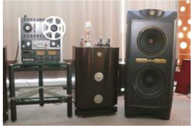
Акустика Tannoy Kingdom Royal, виниловый проигрыватель Michell Engineering Orbe, катушечная дека Studer A-810, усилительная секция S.A.Labs (Нота+)