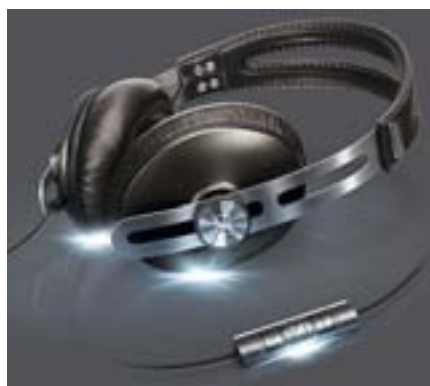
Для диджеев Sennheiser подготовил профессиональные «уши» HD 280 Pro (звукоизоляция 32 дБ), а для эстетов — изысканные Momentum