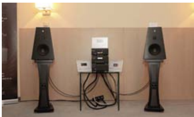
Поющие картины Aleks — единство формы и содержания