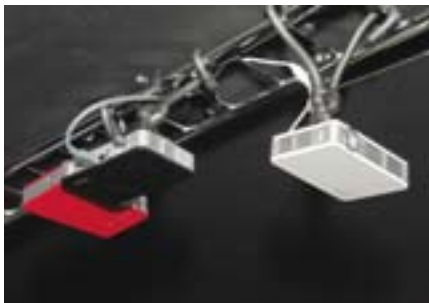
Сборка из HD-пикопрокторов Vivitek Qumi Q5. При яркости 500 ANSI лм и контрастности 10000:1 они демонстрируют детальное изображение на 90-дюймовом экране. Эти небольшие аппараты способны работать без компьютера, поскольку имеют собственную операционную систему и интернет-браузер, поддерживают Wi-Fi. Имеется полный набор интерфейсов, включая HDMI (Digis)