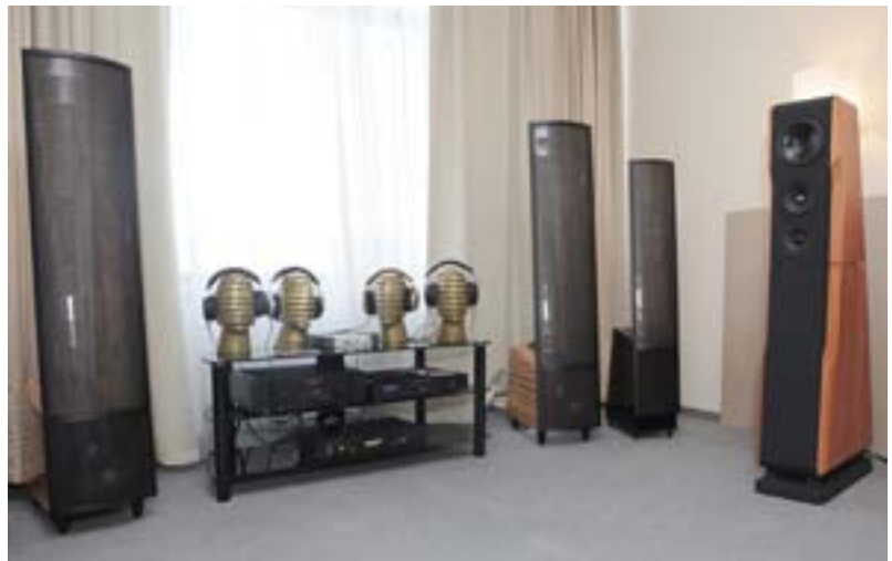
Зона высокого звукового разрешения: стереотелефоны Beyerdynamic, компоненты Audio Analogue и акустика MartinLogan (Русская Игра)

На создание модели Alexia у специалистов Wilson Audio ушло два года. Как видим, в ней используются те же принципы и решения, что в Alexandria, но, в отличие от флагмана, новые системы могут работать в небольших помещениях (Ultima)