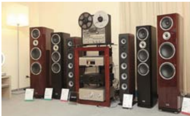
К 100-летию Denon. Компоненты 2013 модельного года и катушечный магнитофон Denon DH-510 в качестве одного из источников. Акустика: HECO и Boston Acoustics (Бонанза)