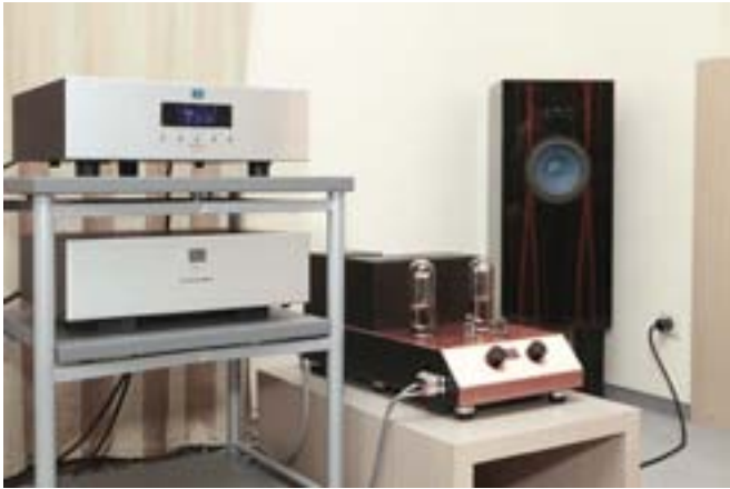
Топовые компоненты Audionote: CD-транспорт CDT Five, цифро-аналоговый преобразователь DAC 6 Special Edition, усилитель Ongaku и акустические системы Audio Note AN-E SEC Signature (Алеф)